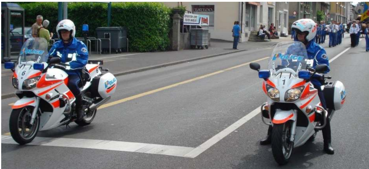
FJR 1300 - 1298 cm 3 - 105 kW (141 CV) 2005 à 2020 & 2020 à ce jour

Après l'Angleterre et ses BSA, l'Allemagne et BMW, la Gendarmerie du Bout du Lac se tourne, en 2005, du côté du Pays du Soleil Levant pour renouveler sa flotte de motos. C'est ainsi que 17 Yamaha FJR 1300, entièrement équipées "Police" par Yamaha Suisse à Sursee/LU, sont livrées à Genève au début décembre 2005.